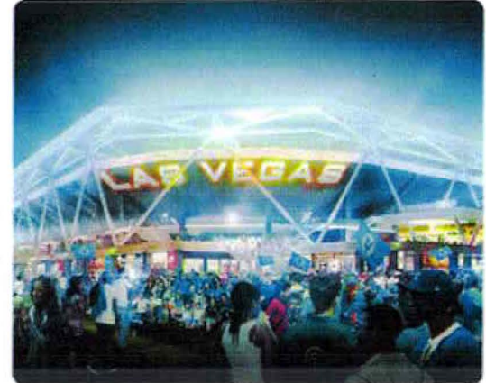
Los propietarios del estadio serían individuos del sector privado. ¿Dónde están los líderes futboleros de LV?

La mayoría de nuestra gente no reconoce el poder